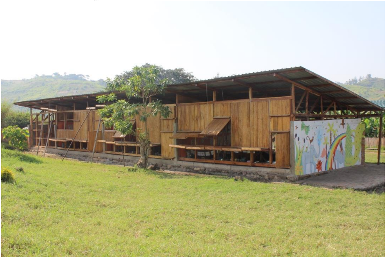
Aulas de infantil