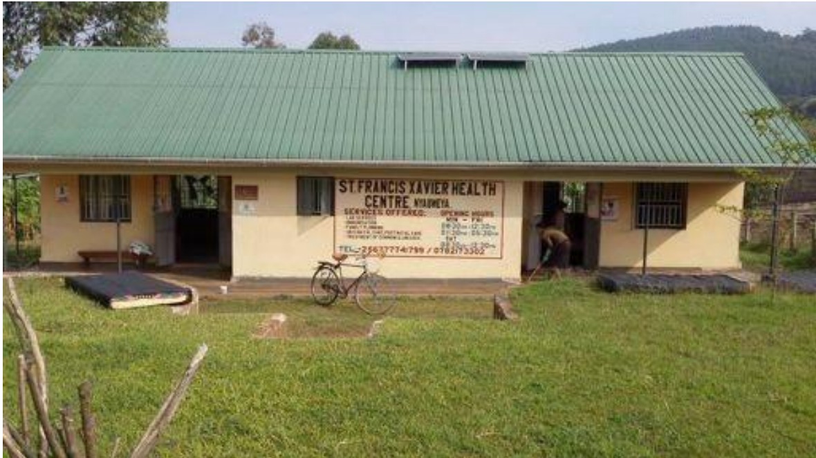
Clínica St Francis