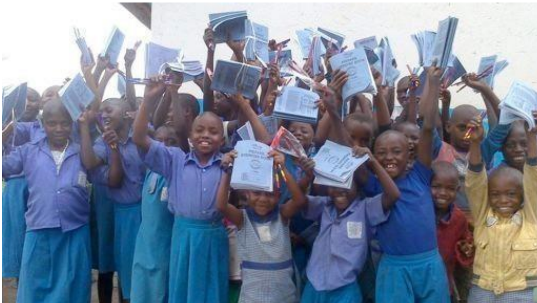
Niños apadrinados en Ruigo Academy