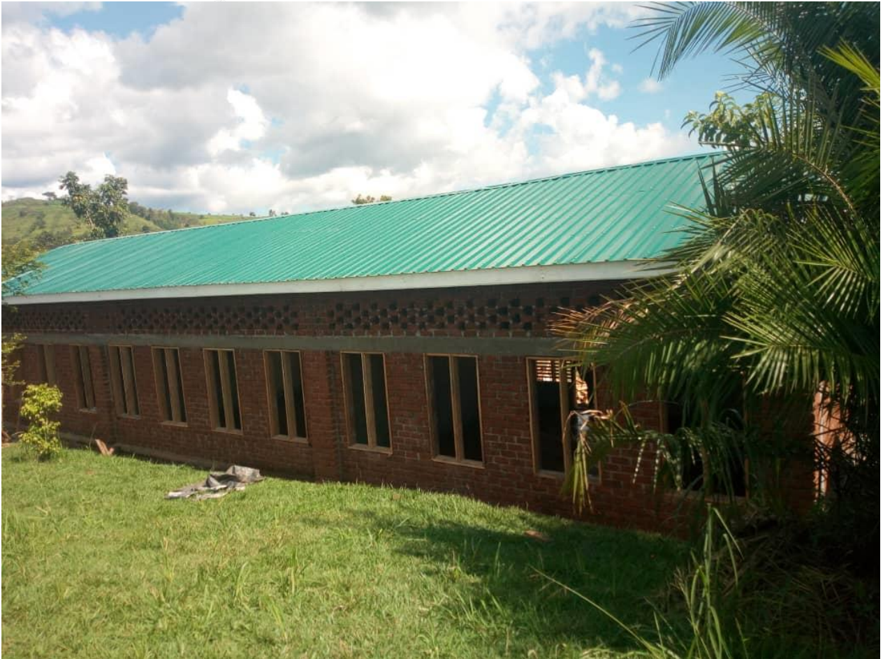
Nuevas aulas de primaria