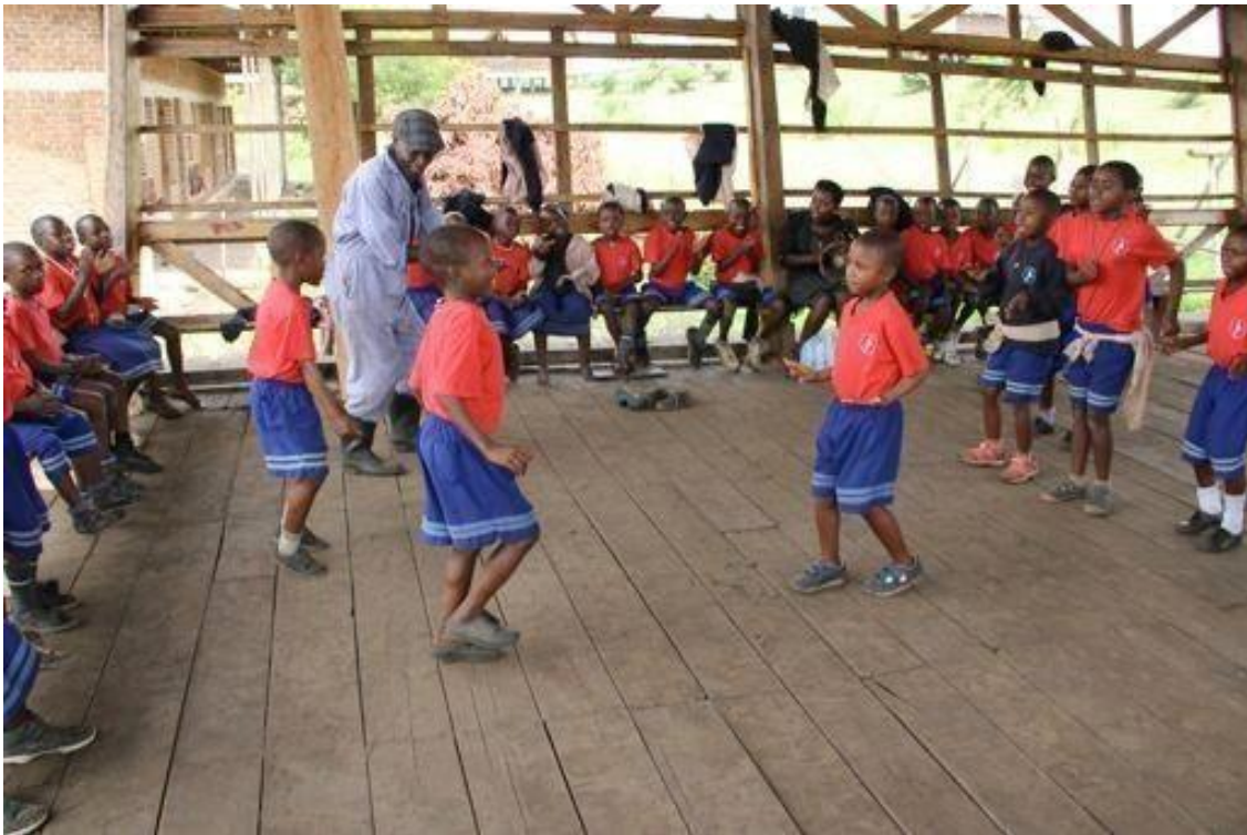
Primero y segundo de primaria jugando