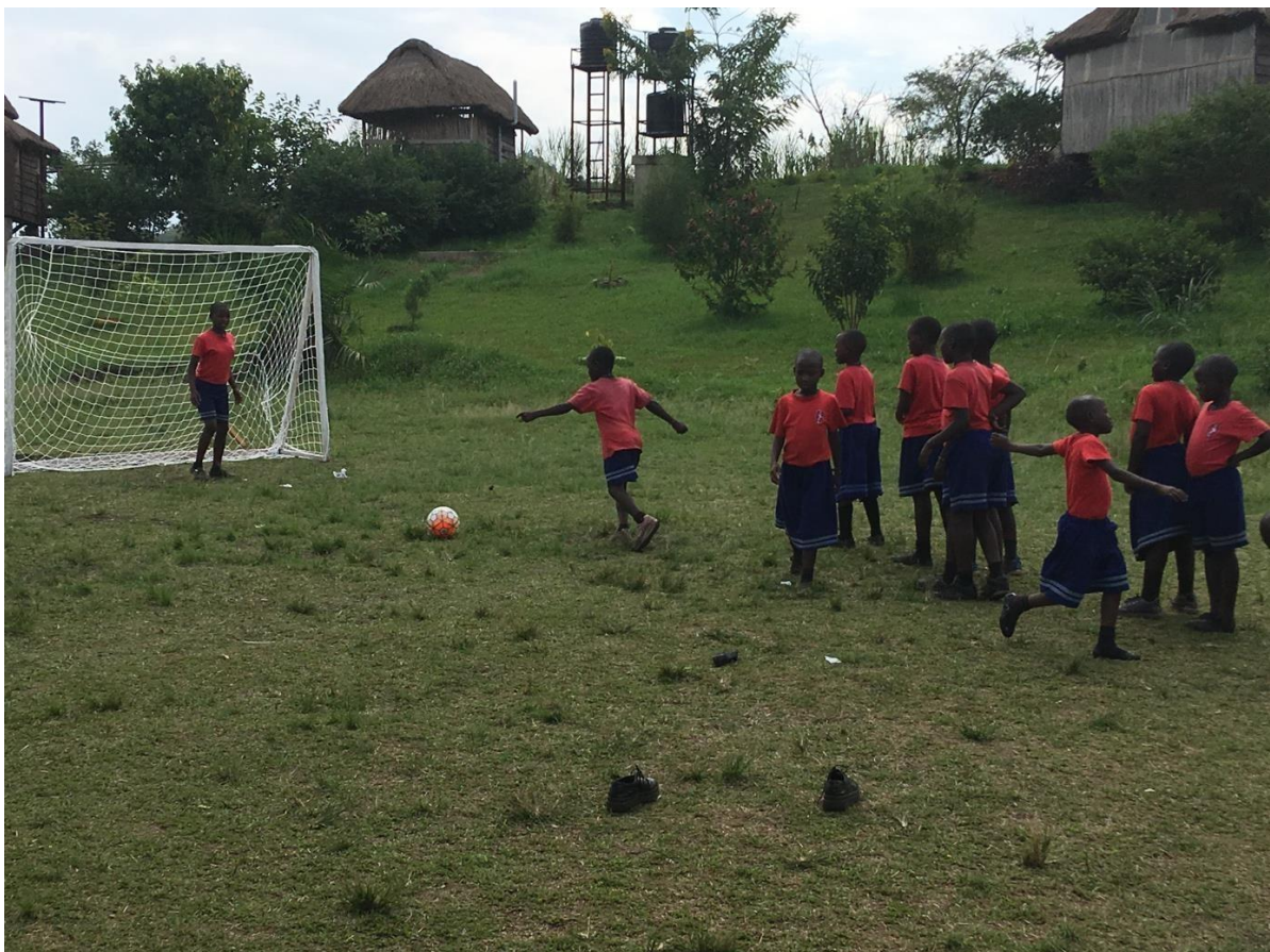
Jugando al fútbol