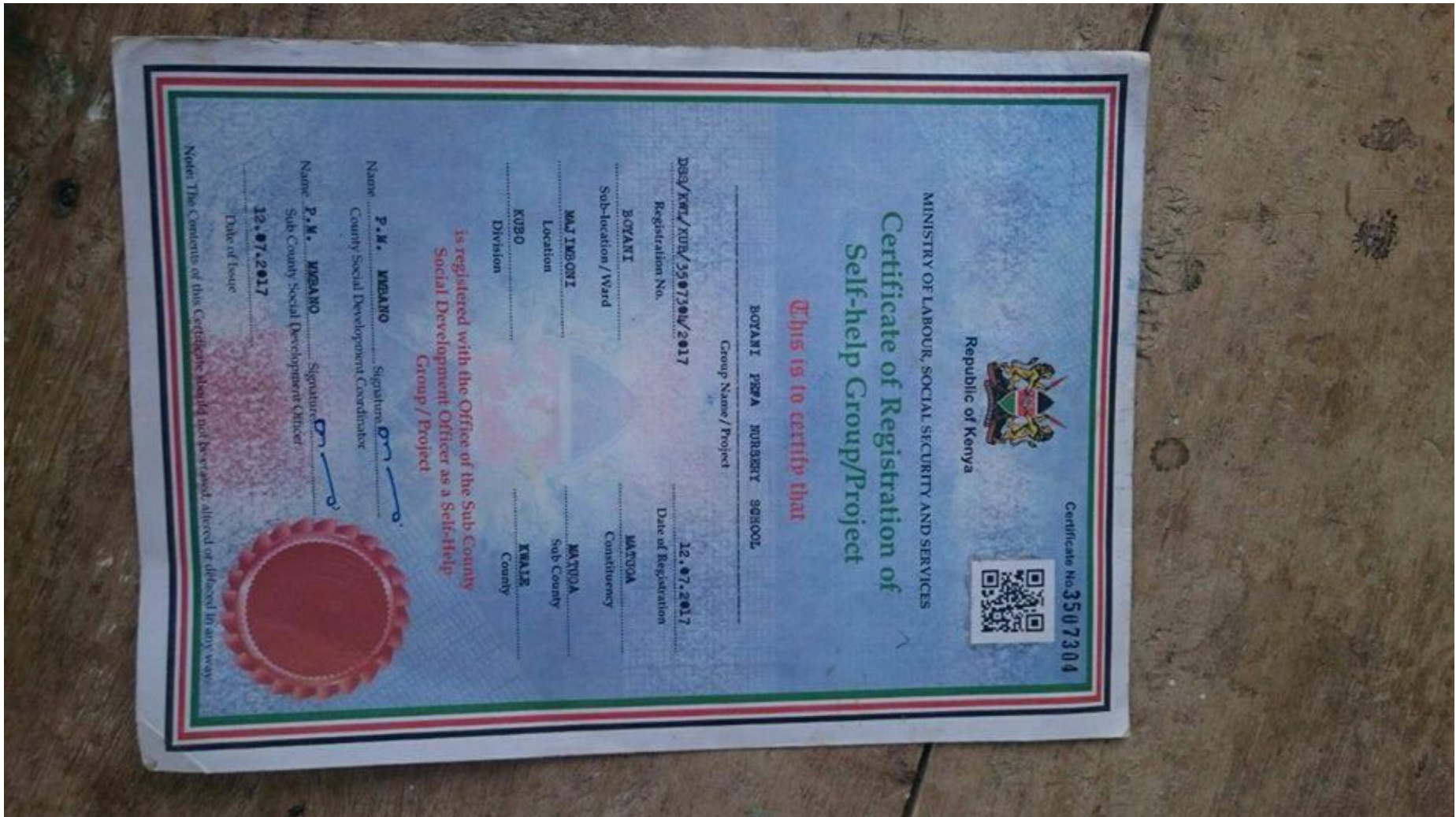
Projektzertifikat „ self help project“